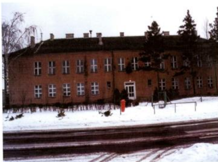
Szkoła Podstawowa w Bielsku