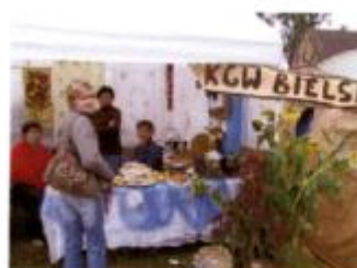
Na zdjęciach członkinie koła Gospodyń Wiejskich wystawiające się na Dożynkach Powiatowych w Orchowie