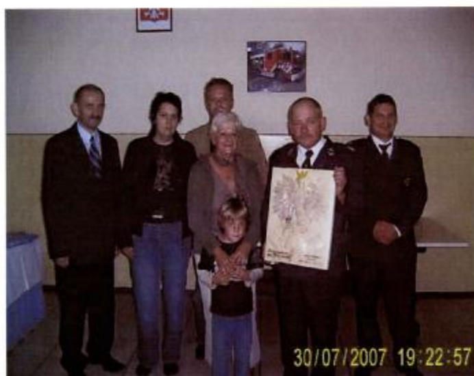
Na zdjęciu goście z Holandii, komendant Straży Pożarnej w Bielsku, oraz Wójt Gminy Orchowo