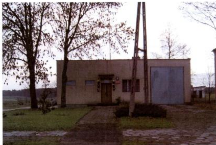
Budynek Straży Pożarnej w Bielsku