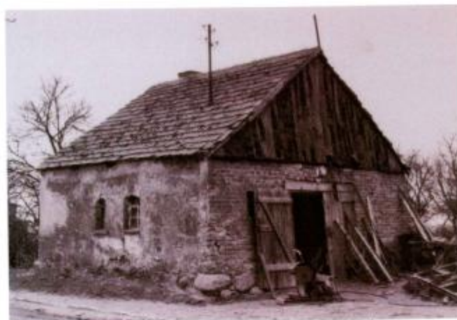
Na fotografii zabytkowa Kuźnia pobudowana w 2 połowie XIX wieku.

Nazwa wsi Bielsko urobiła się stosunkowo szybko i łatwo. U zarania dziejów w 1193 r. funkcjonowała nazwa Belsco, nieco później w 1215 r. spotykamy Belzco. Podobnie w 1231 r., natomiast w 1368 r. znajdujemy Bielsko, formę całkowicie zbliżoną do współczesnej nazwy. Po Powstaniu Wielkopolskim w 1919 r. kolonię Annaberg nazwano, Podbielsko, a w obrębie przedrozbiorowego Bielska urobiły się funkcjonujące do dziś dnia nazwy Bielsko i Podbielsko.