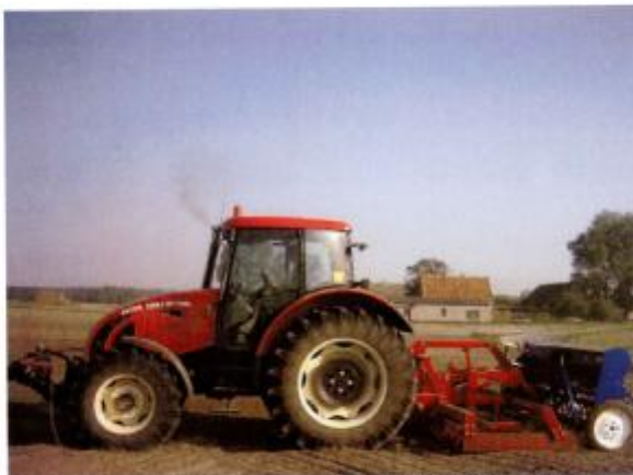
Na zdjęciu ciągnik rolniczy wraz z zestawem uprawowo – siewnym

Miejscowi gospodarze rolni posiadają wysoce wyspecjalizowany sprzęt do uprawy roślin.